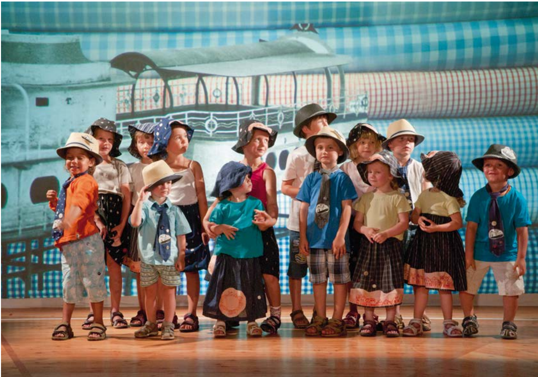
TEUFENBACH 1 Das Fest in Teufenbach / Tableau Vivant