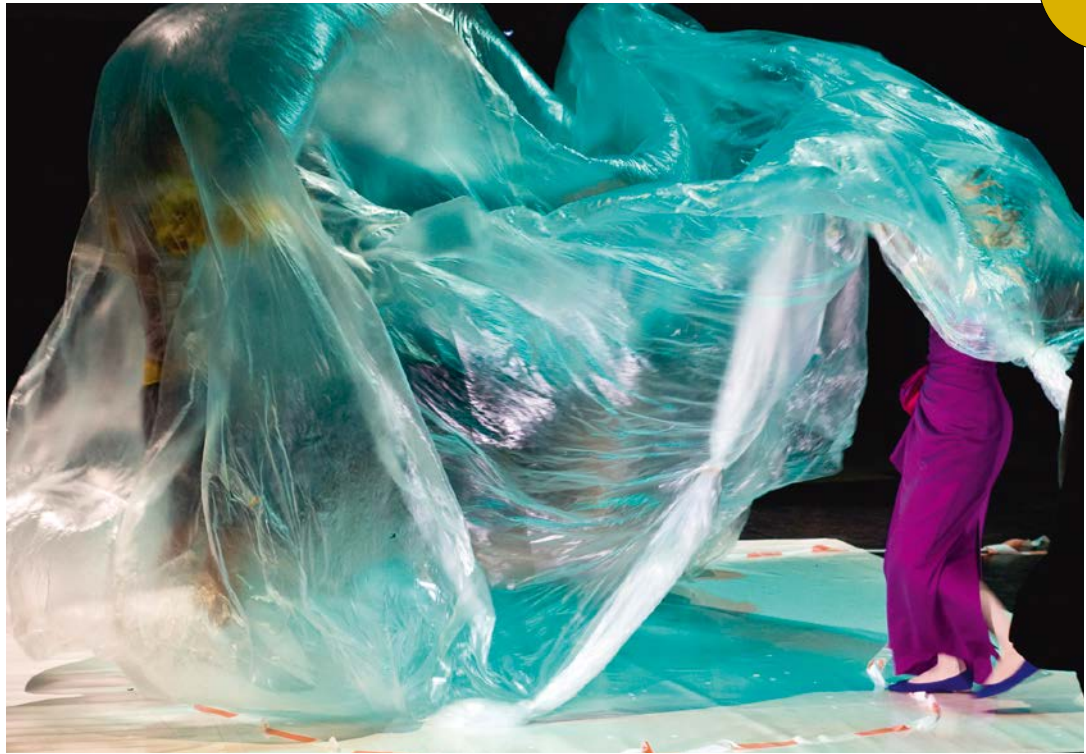
Pandemie Natascha Gangl, Theater am Lend