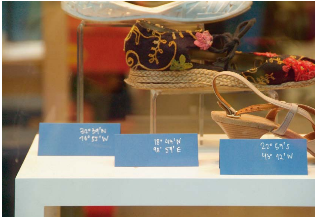
SHOPS OF STORIES ,Installation'