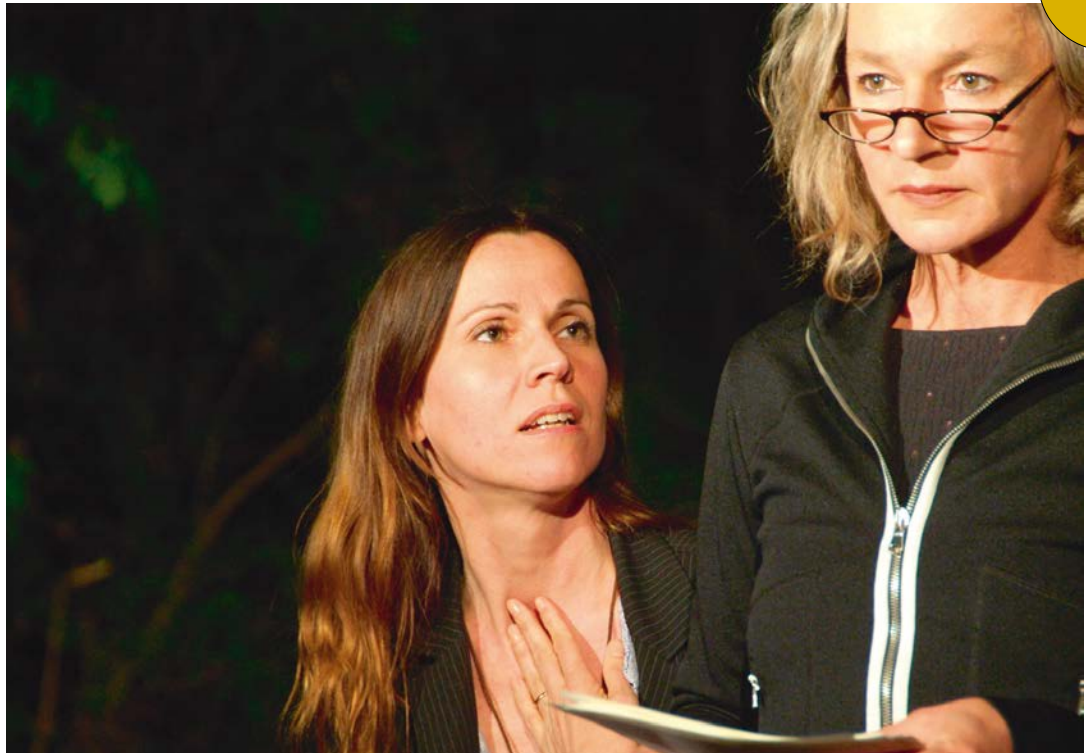
Interpretationssache 2012, Bildungshaus Schloss Retzhof