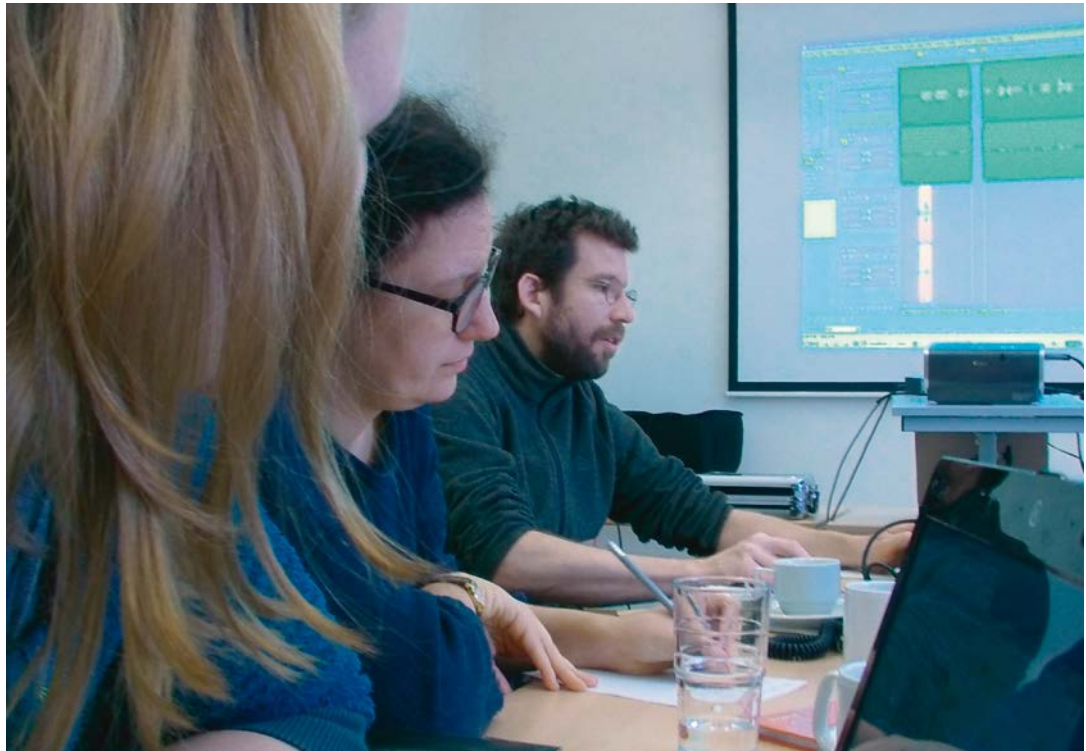
FORUM Text Bildungshaus Schloss Retzhof