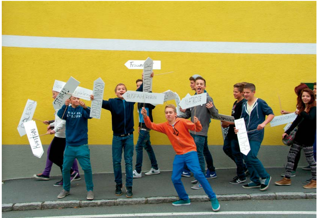
BOXENSTOPP Flashmob in Leibnitz Foto/Rappel