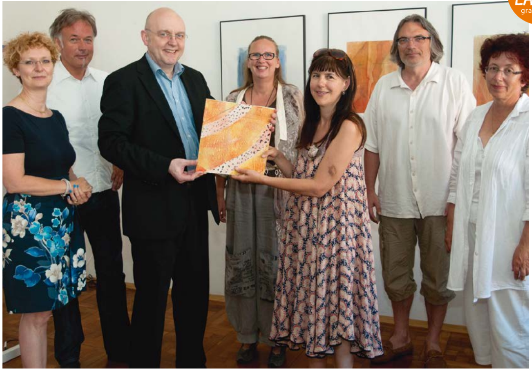
LQW Lernerorientierte Qualitätstestierung in der Weiterbildung Zertifikatsüberreichung