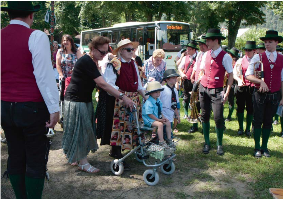
TEUFENBACH 1 Das Fest in Teufenbach