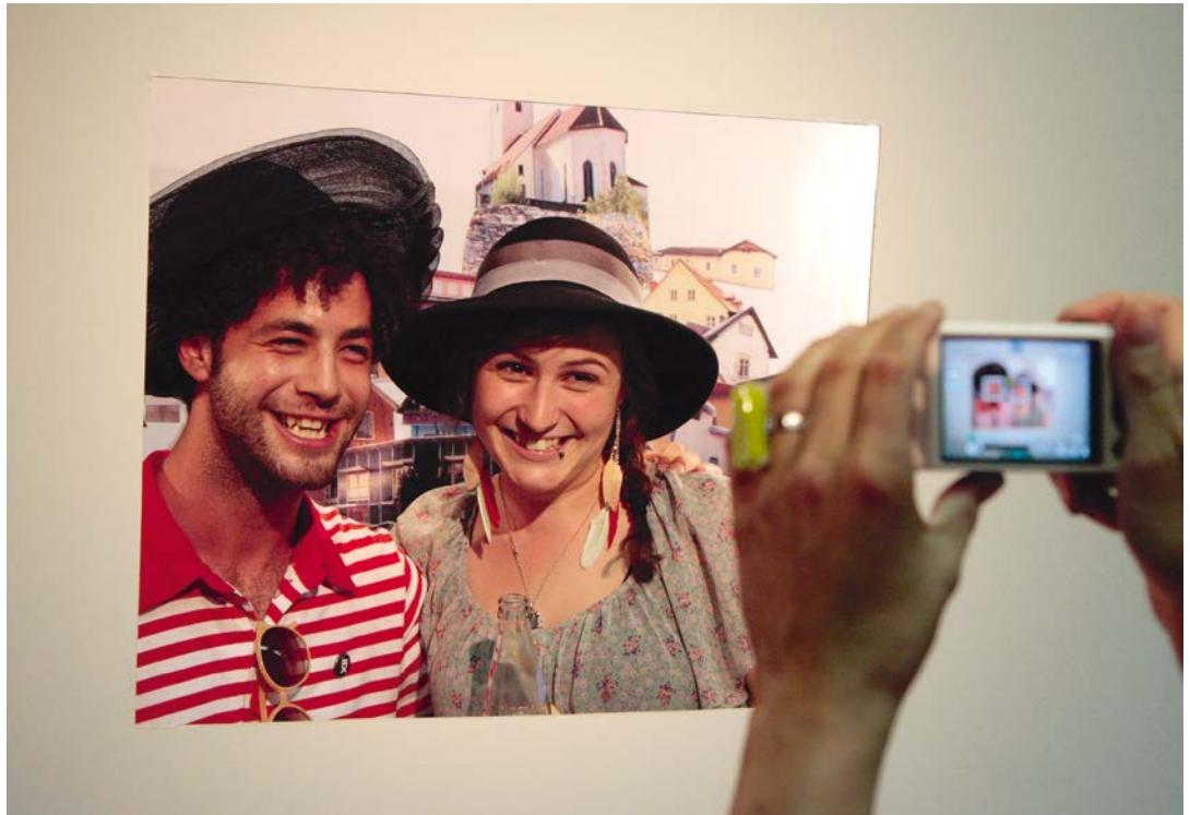
TEUFENBACH 1 Eröffnung des Shops in Murau