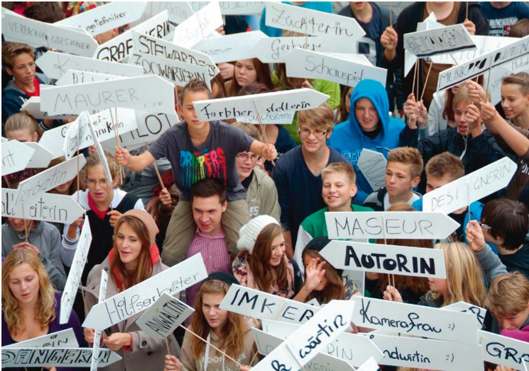
BOXENSTOPP Flashmob am Leibnitzer Hauptplatz