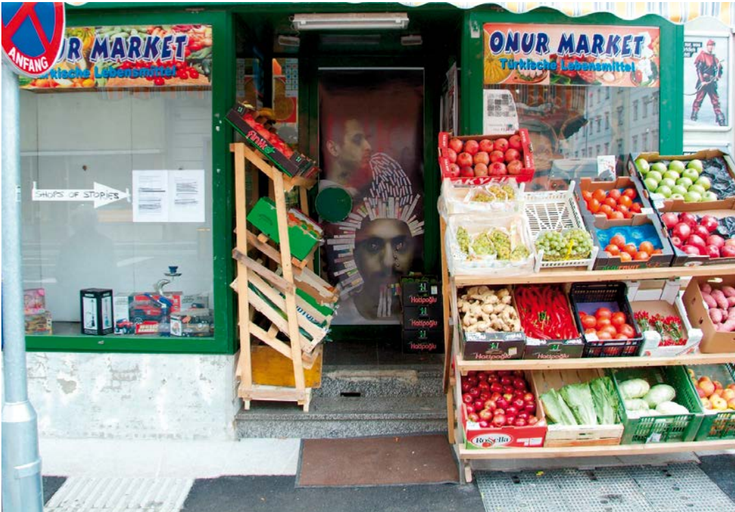
SHOPS OF STORIES