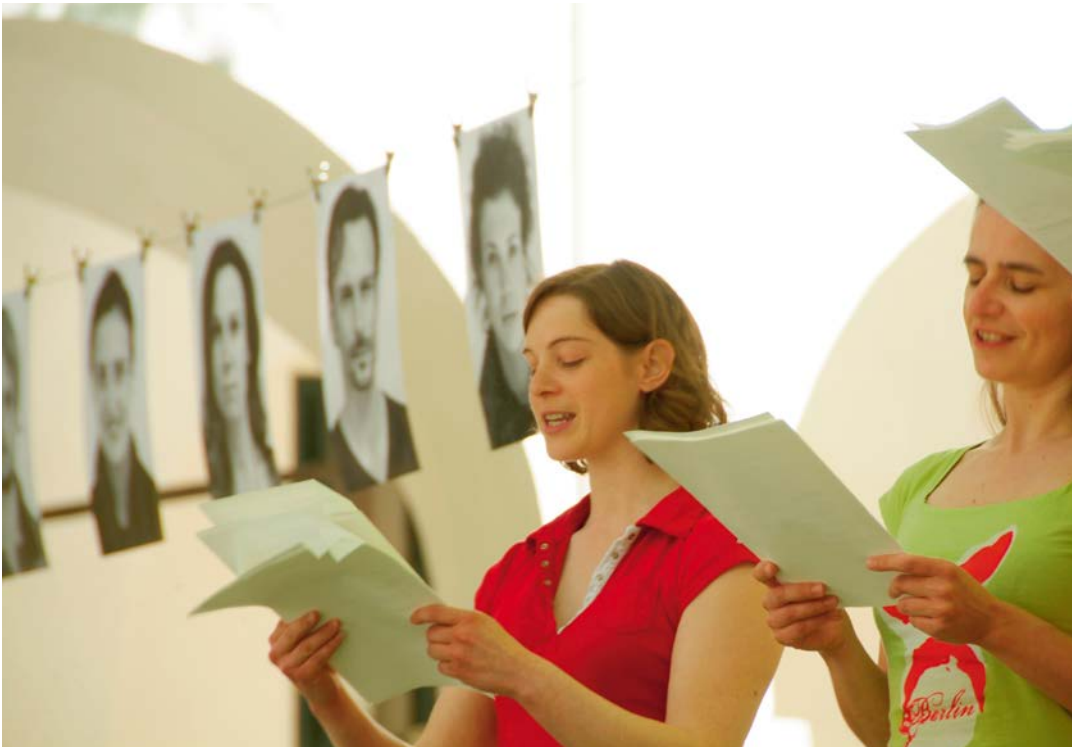
Interpretationssache 2012, Bildungshaus Schloss Retzhof