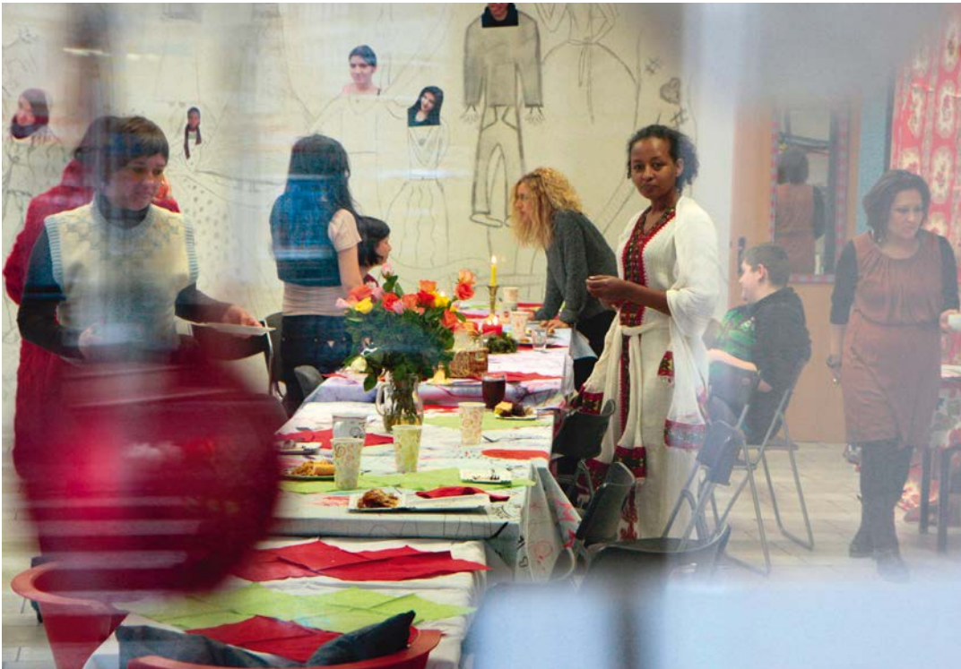
FRAUENLEBEN LernBox