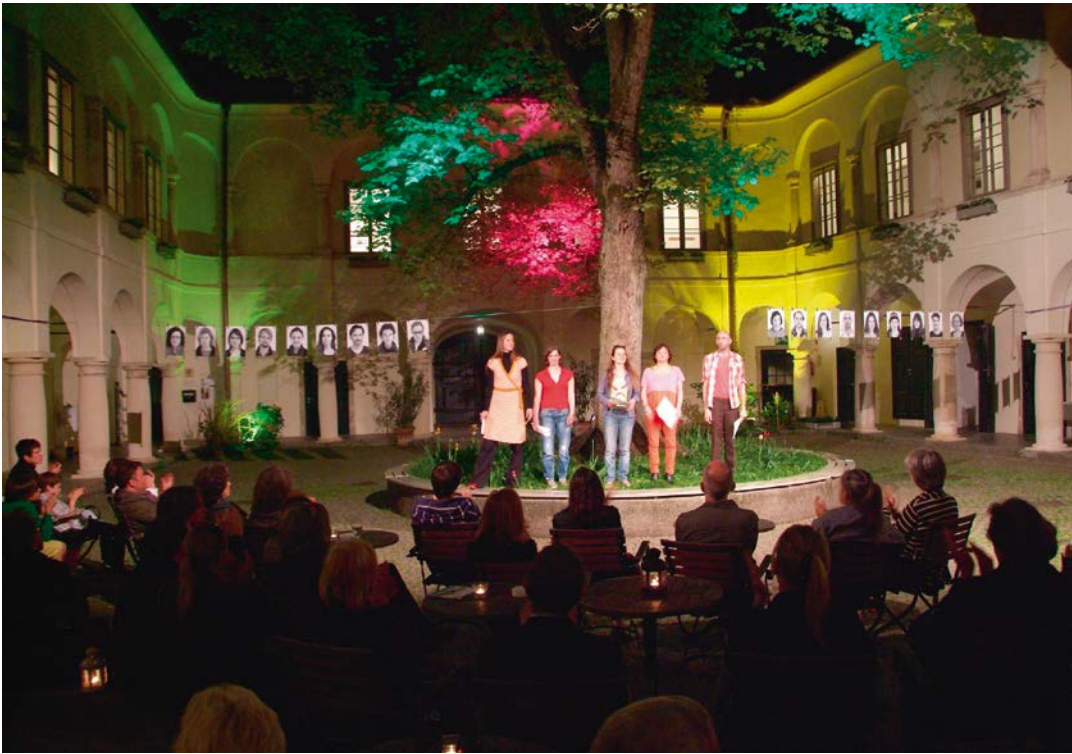
Interpretationssache 2012, Bildungshaus Schloss Retzhof