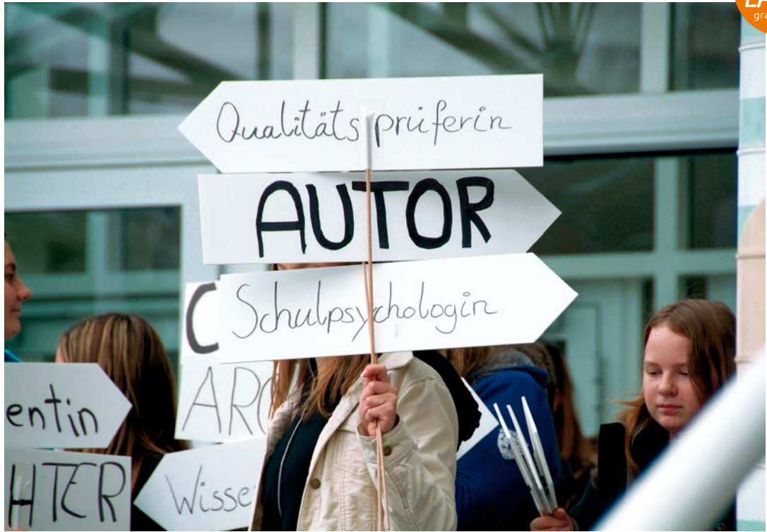
BOXENSTOPP Flashmob am Leibnitzer Hauptplatz