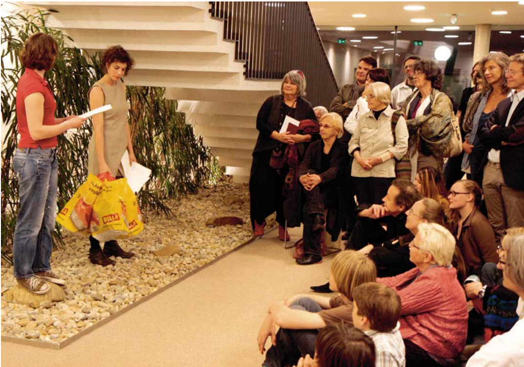
Interpretationssache 2012, Bildungshaus Schloss Retzhof