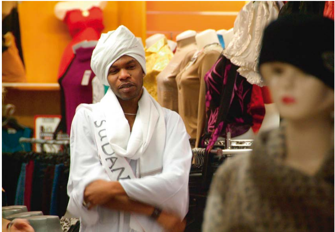
SHOPS OF STORIES ,Modenschau', Maryam Mohammadi/Jin Yan