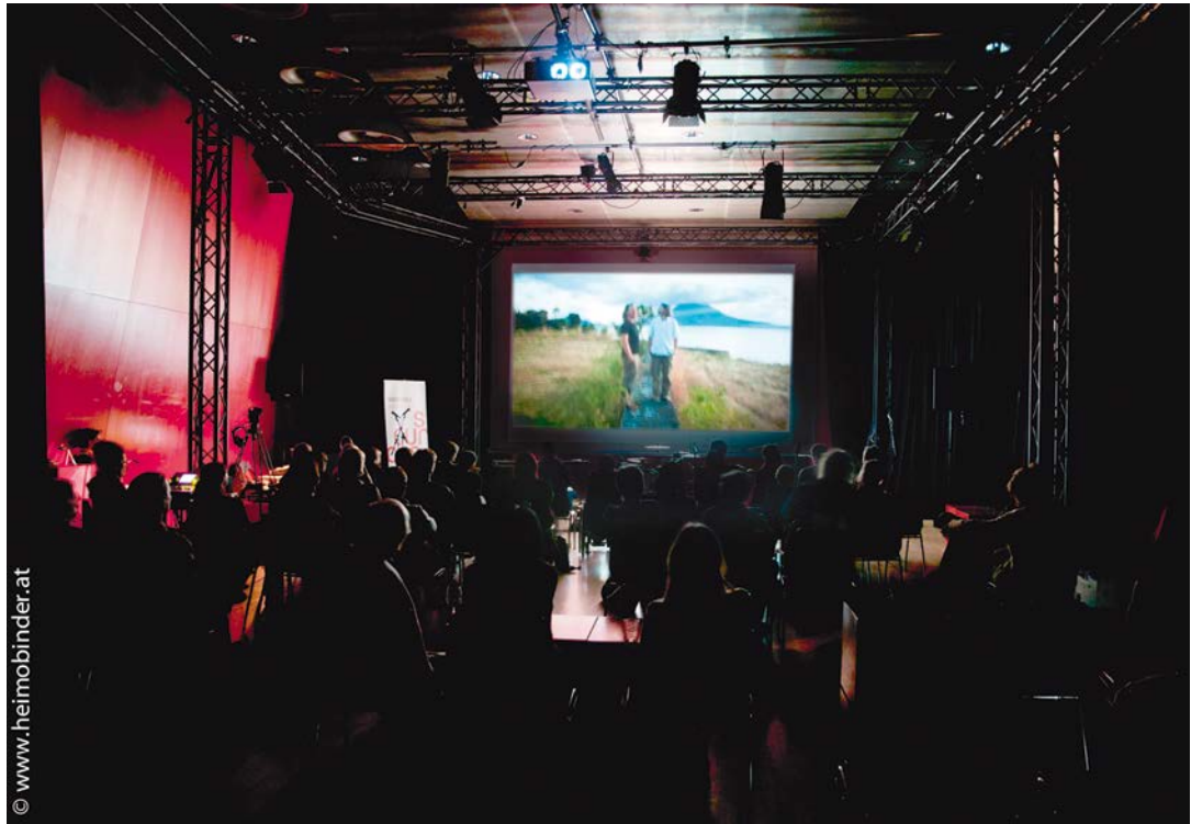
Sources 2 Theater am Lend