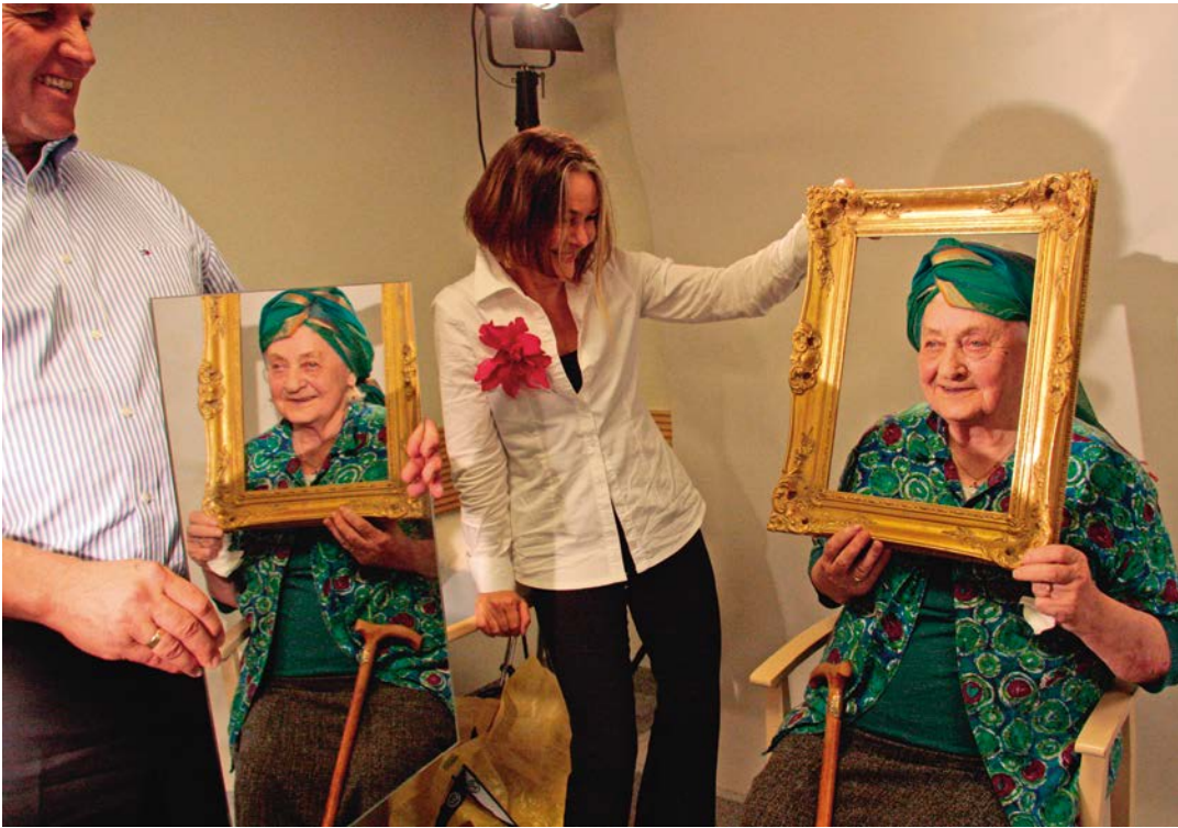
TEUFENBACH 1 Fotoshooting