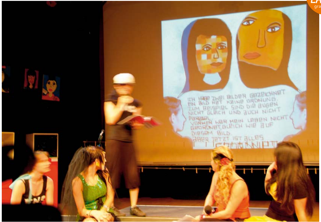
RAUS AUS DER BOX Abschlusspräsentation