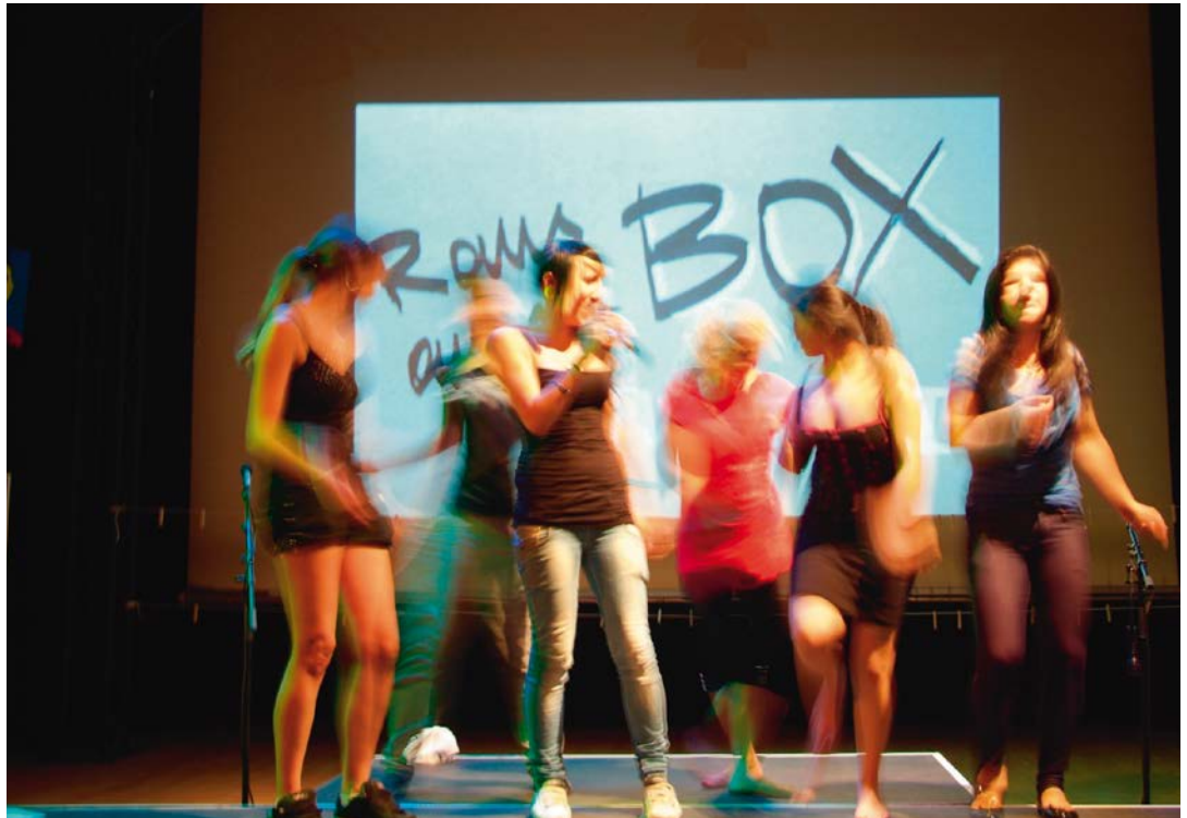
RAUS AUS DER BOX Abschlusspräsentation