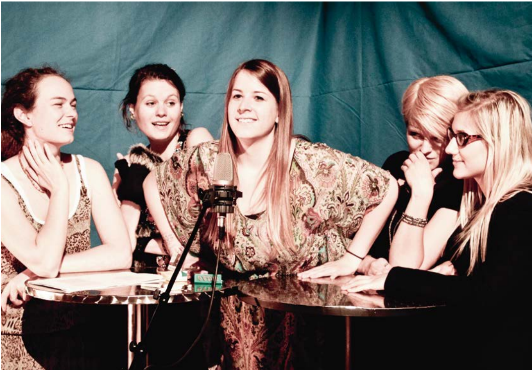
TARNEN UND TÄUSCHEN Studententheater, Regie: Astrid Ranner; Theater am Lend