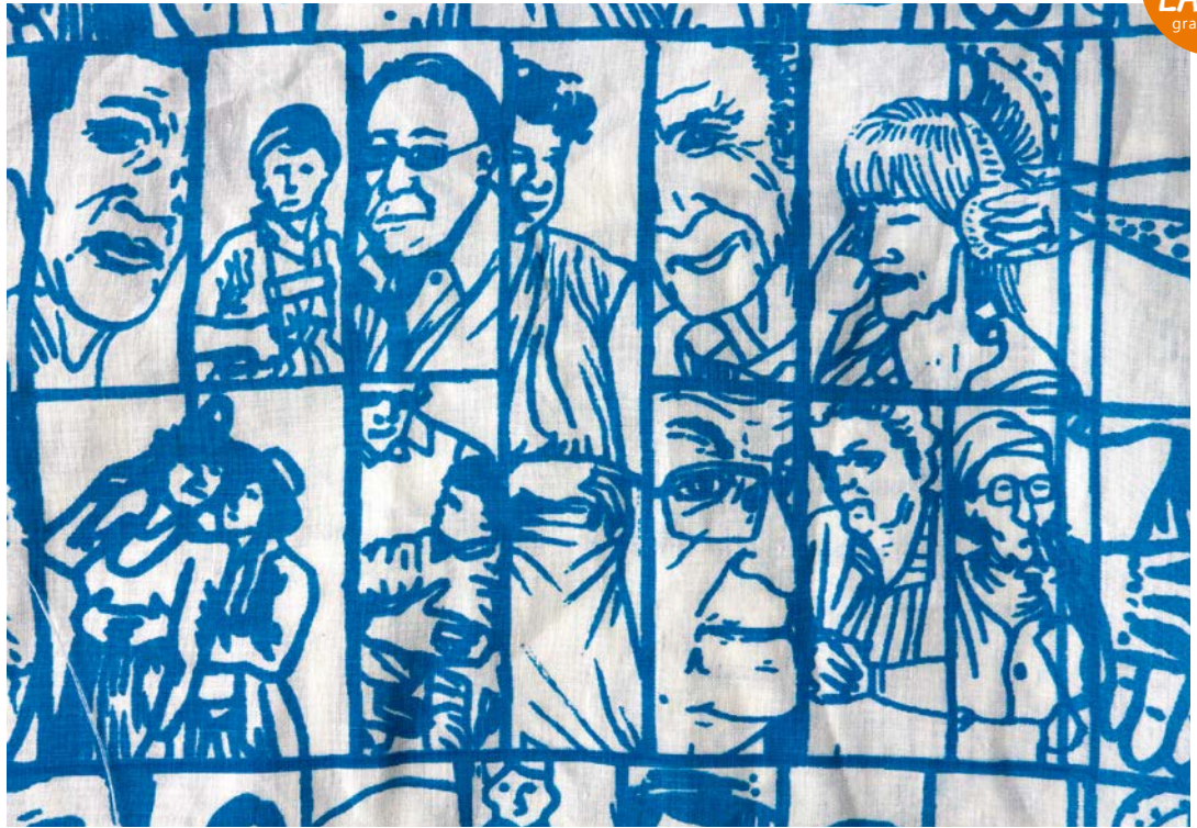
TEUFENBACH 1 Stoffmuster