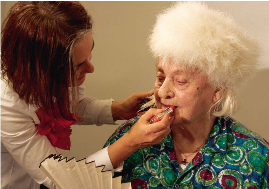
TEUFENBACH 1 Fotoshooting