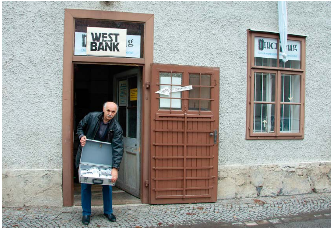
SHOPS OF STORIES ,Lastung', Mirko Maric Foto/Rappel