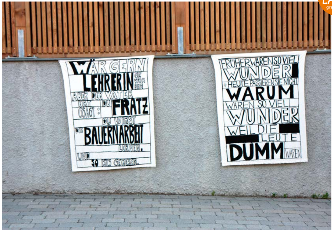
TEUFENBACH 1 Textfahnen Foto/Rappel