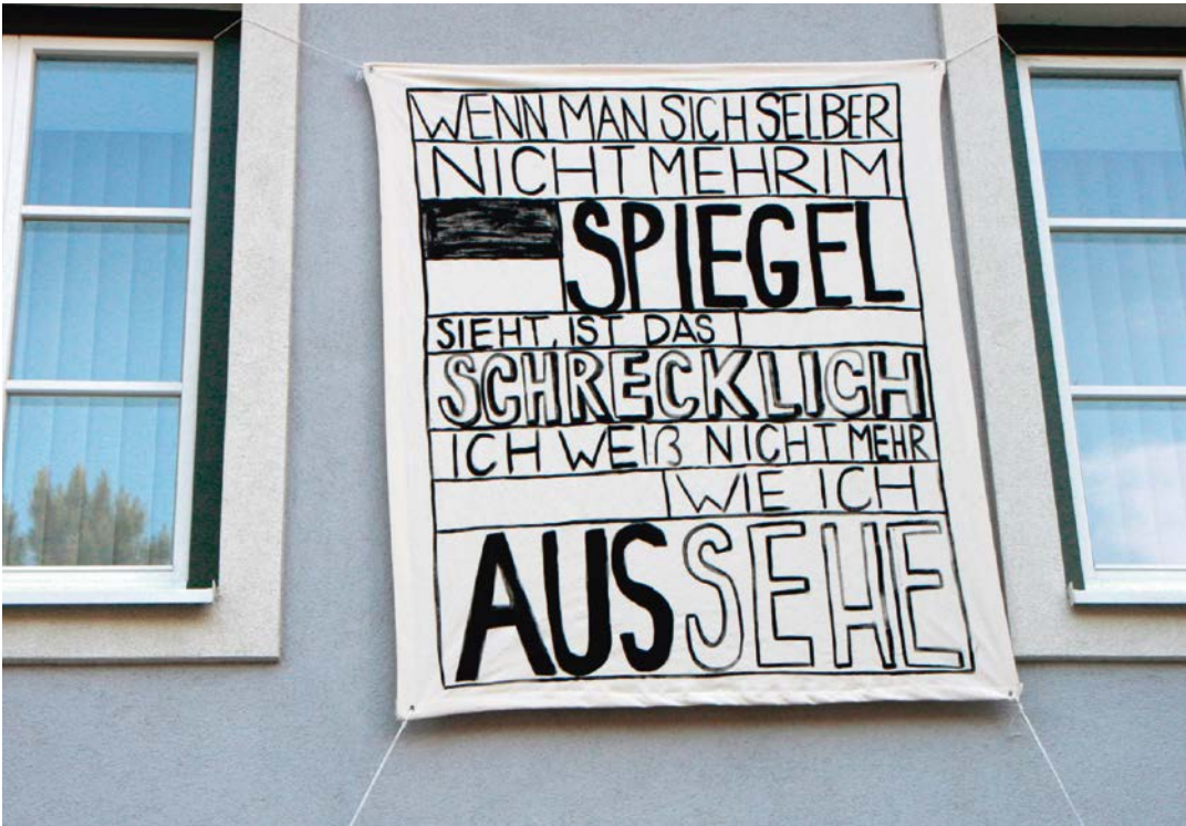
TEUFENBACH 1 Textfahnen Foto/Rappel