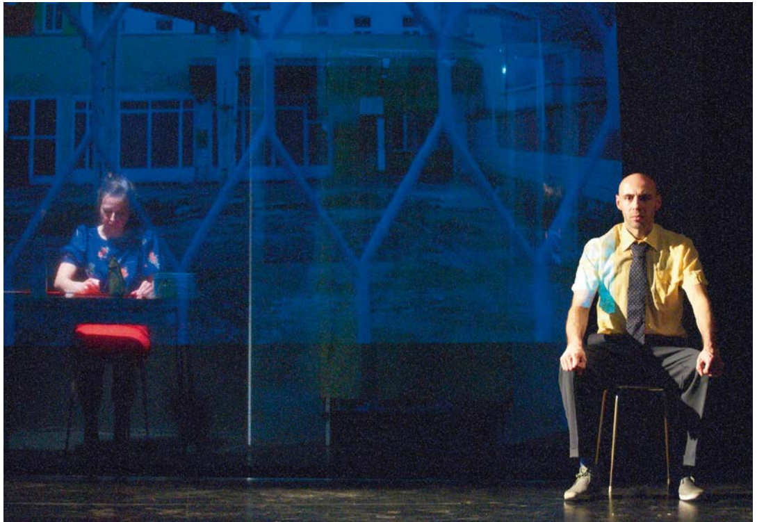
Samurai / Futuresong Dea Loher / Sandra Schüddekopf, (Katrin Schurich, Florian Tröbinger), Theater am Lend