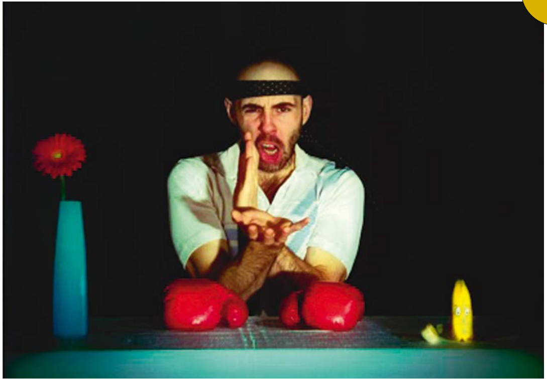
Samurai / Futuresong Dea Loher / Sandra Schüddekopf, (Florian Tröbinger), Theater am Lend Foto/Produktion