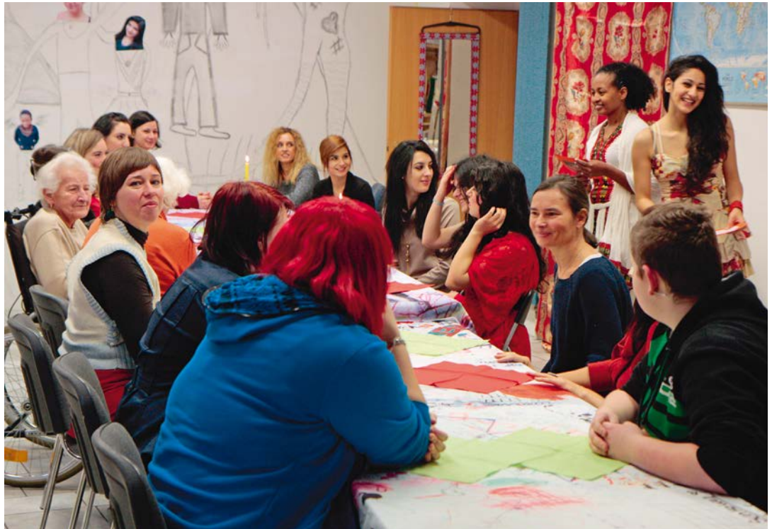
FRAUENLEBEN LernBox