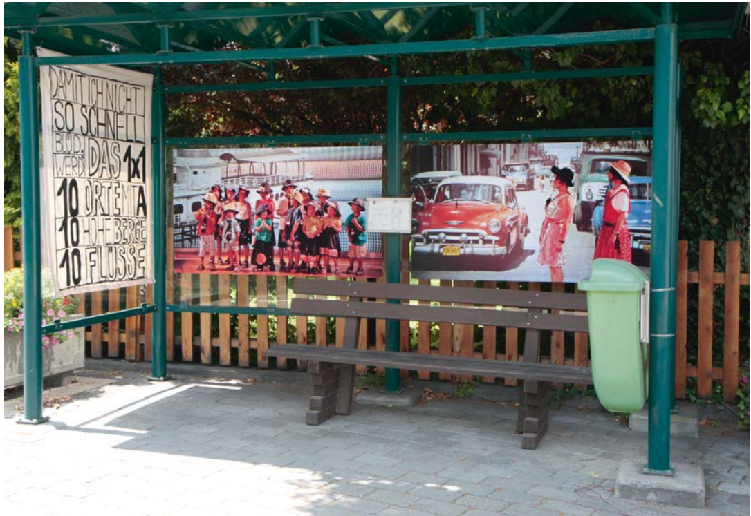
TEUFENBACH 1 ... im öffentlichen Raum