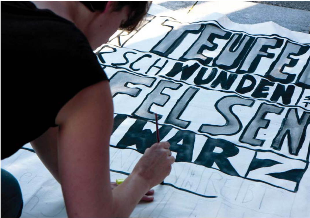
TEUFENBACH 1 Textfahnen