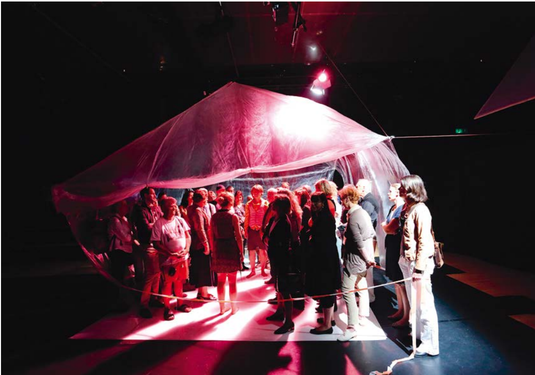
Pandemie Natascha Gangl, Theater am Lend