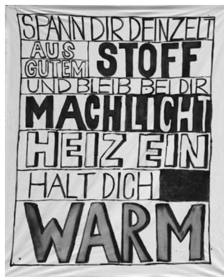
Textfahne / Teufenbach

(Aus: Die Presse, Print-Ausgabe, 14. 07. 2012)