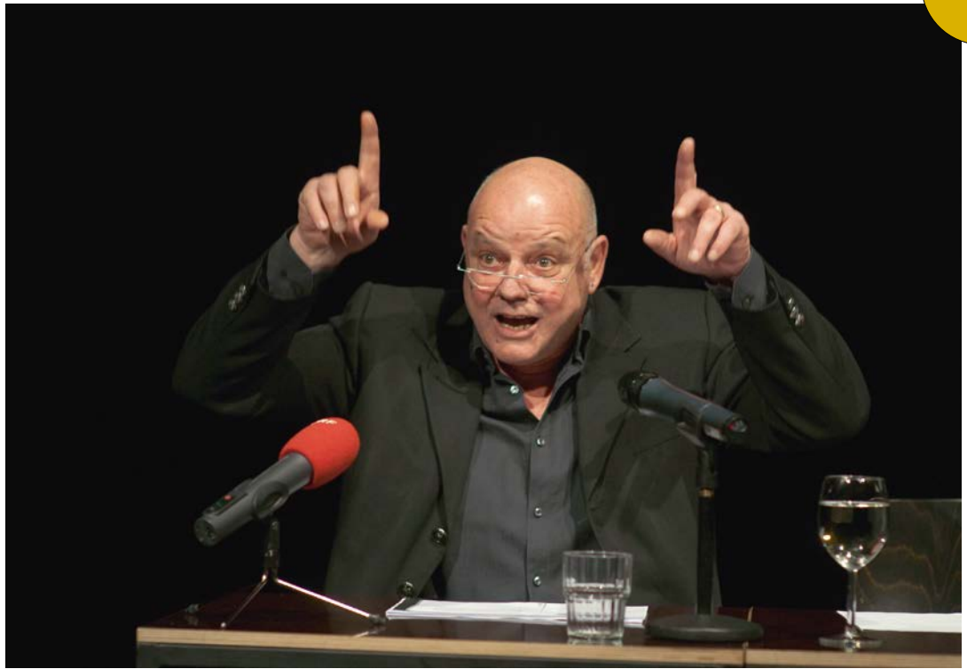
Böck liest Bauer Theater am Lend