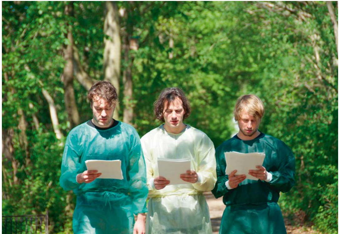
Interpretationssache 2012, Bildungshaus Schloss Retzhof