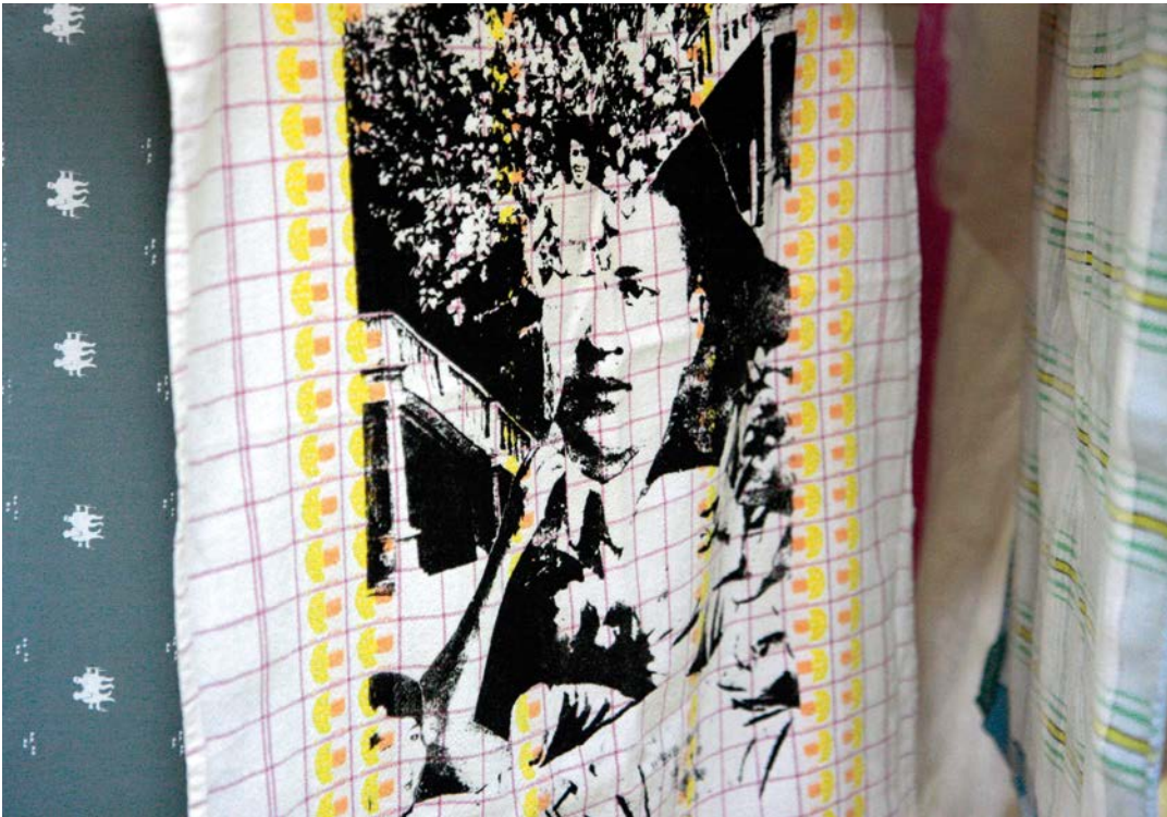
TEUFENBACH 1 Stoffmuster