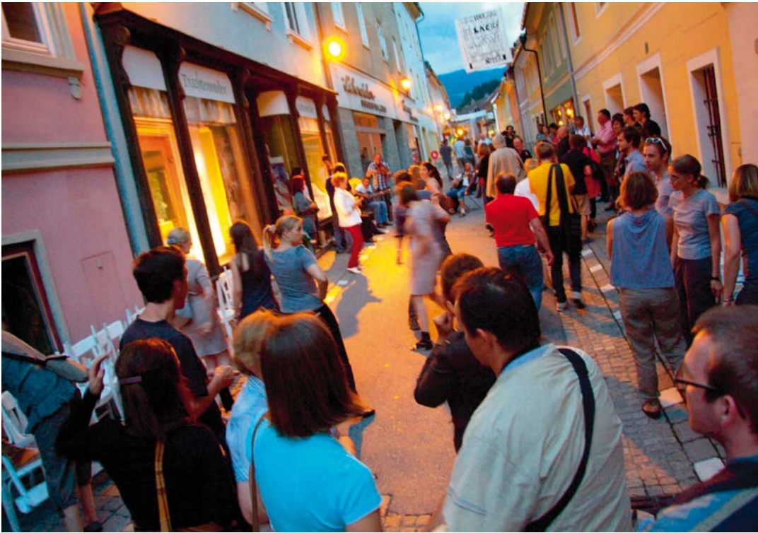
TEUFENBACH 1 Eröffnung des Shops in Murau