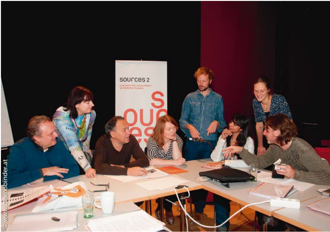
Sources 2 Theater am Lend