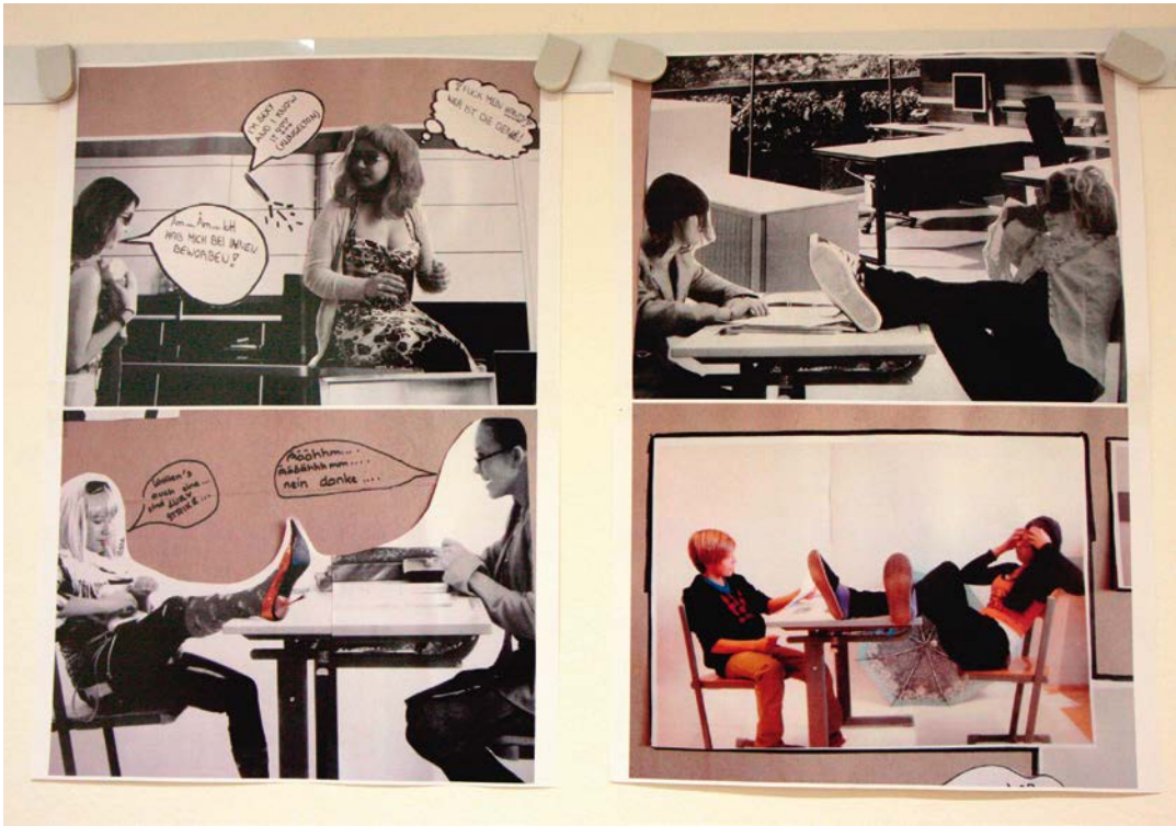
BOXENSTOPP Collage aus Schulworkshop