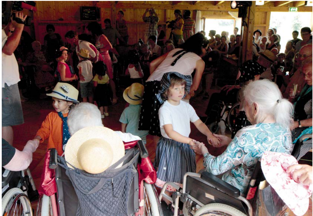
TEUFENBACH 1 Das Fest in Teufenbach