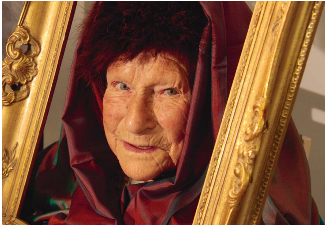
TEUFENBACH 1 Fotoshooting