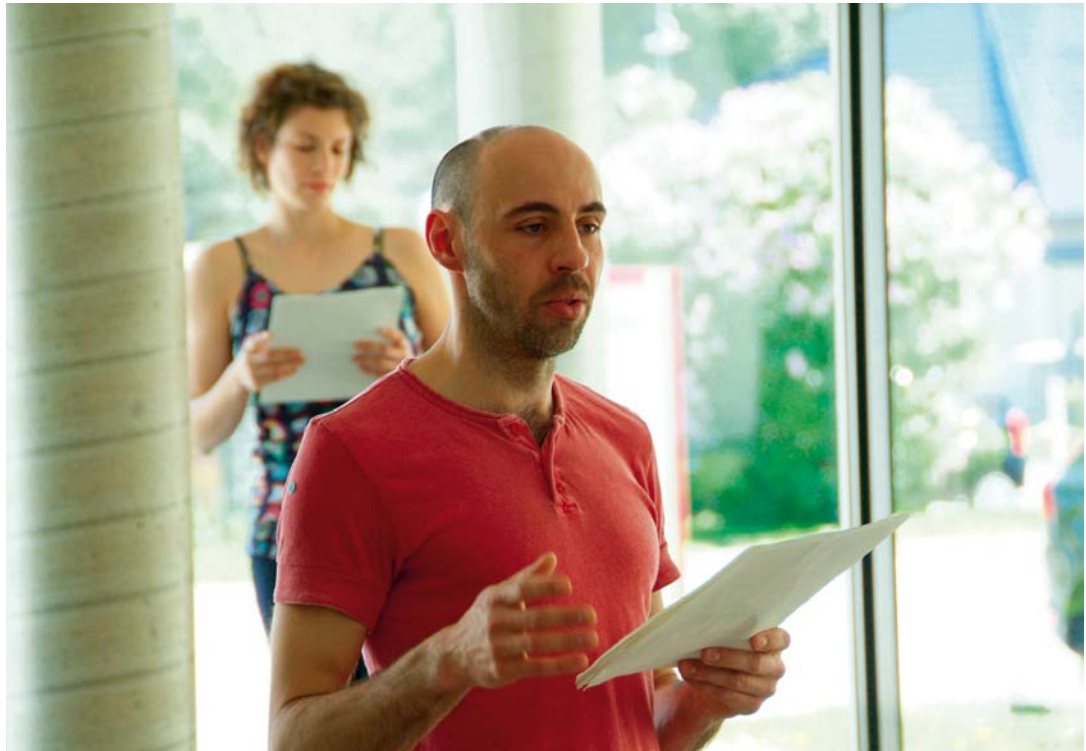
Interpretationssache 2012, Bildungshaus Schloss Retzhof