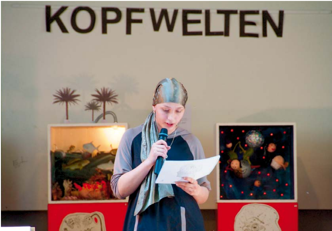
RAUS AUS DER BOX Präsentation ‚Kopfwelten‘