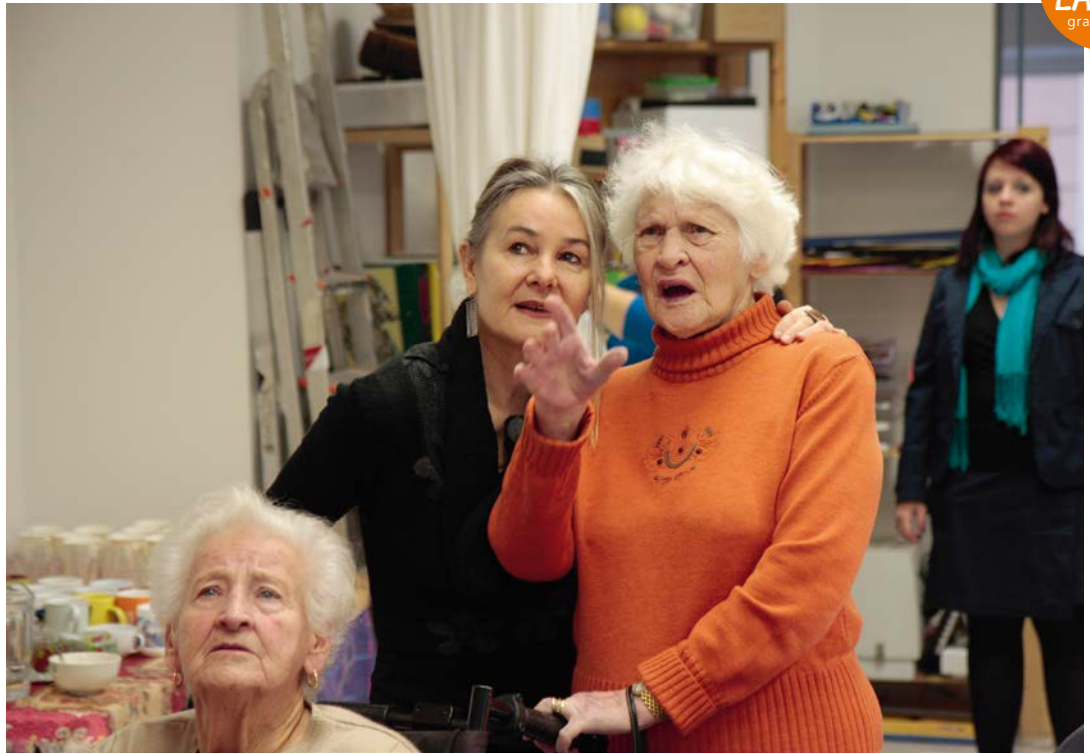
FRAUENLEBEN Caritas Senioren- und Pflegewohnhaus Graz-St. Peter