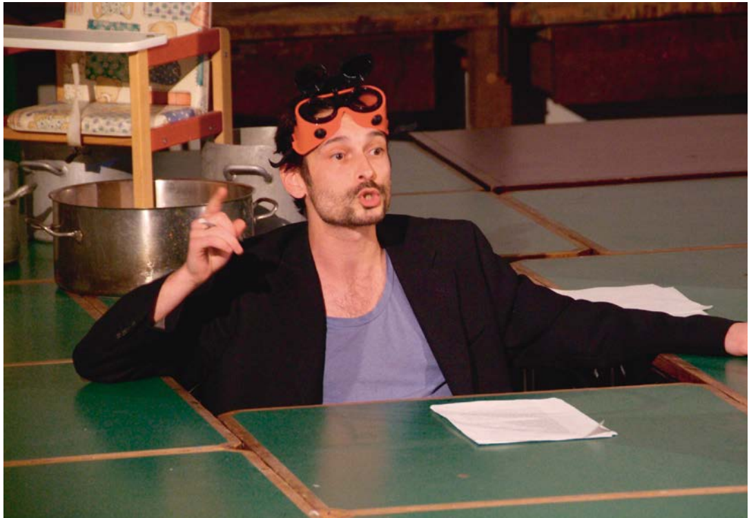
Interpretationssache 2012, Bildungshaus Schloss Retzhof