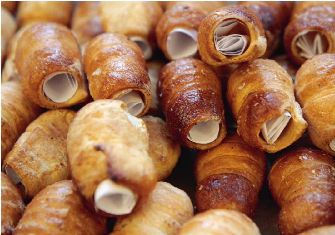
SHOPS OF STORIES ,Textrollen' Foto/Rappel