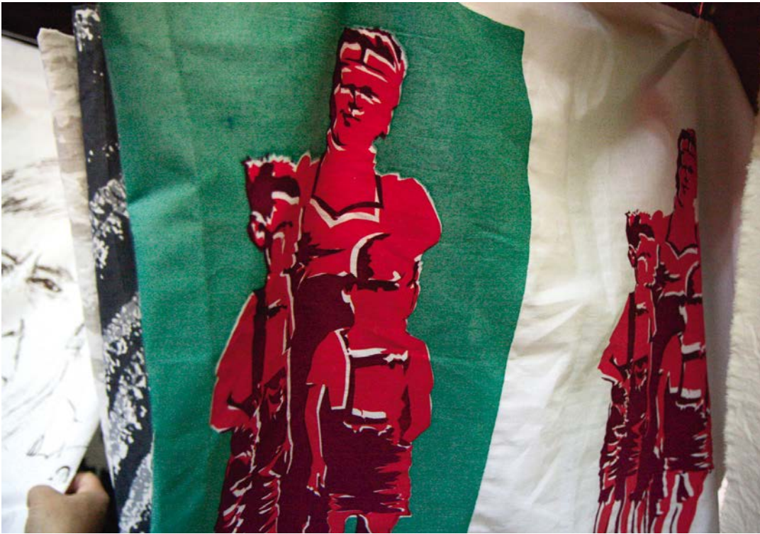
TEUFENBACH 1 Stoffmuster