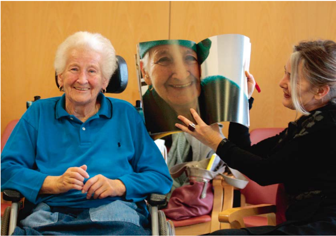
FRAUENLEBEN Caritas Senioren- und Pflegewohnhaus Graz-St. Peter