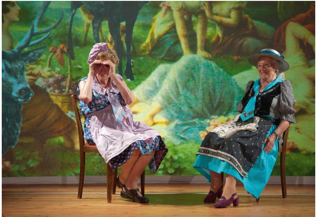
TEUFENBACH 1 Das Fest in Teufenbach / Tableau Vivant