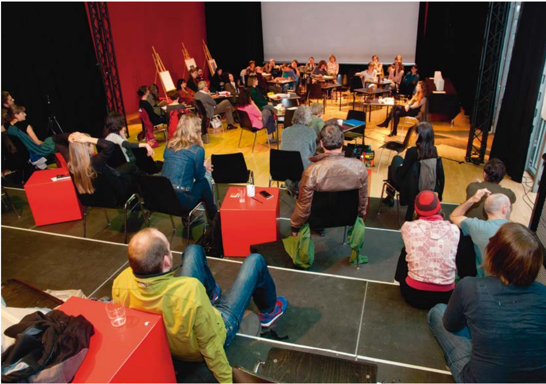
KRITIKFABRIK Theater am Lend