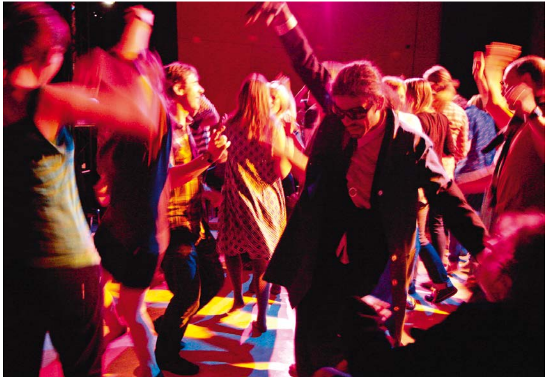
FOREVER YOUNG Studententheater, Regie: Sandra Schüddekopf; Theater am Lend