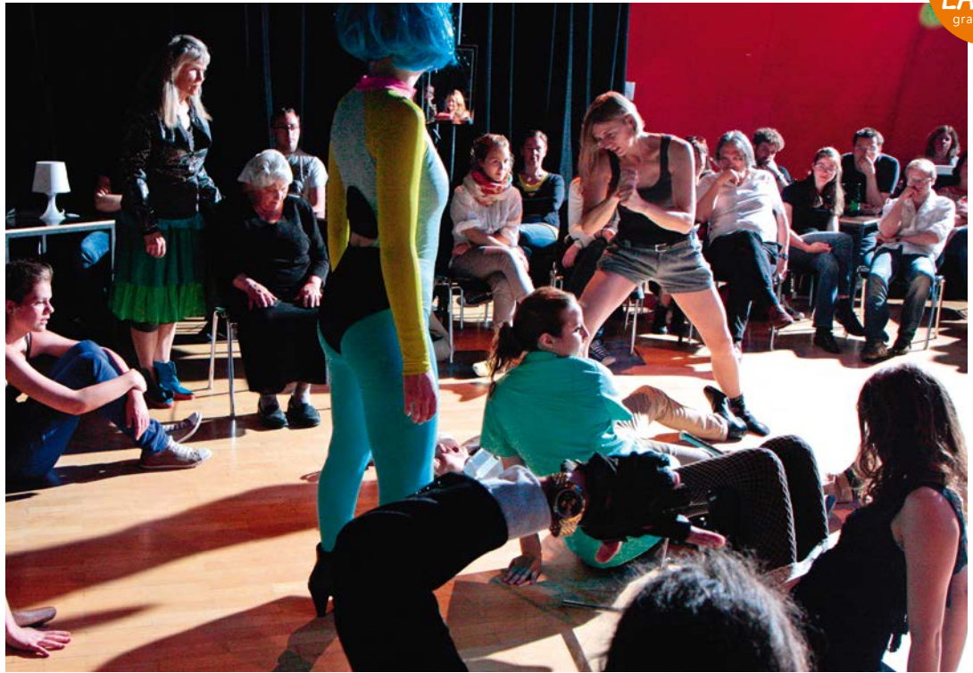
FOREVER YOUNG Studententheater, Regie: Sandra Schüddekopf; Theater am Lend