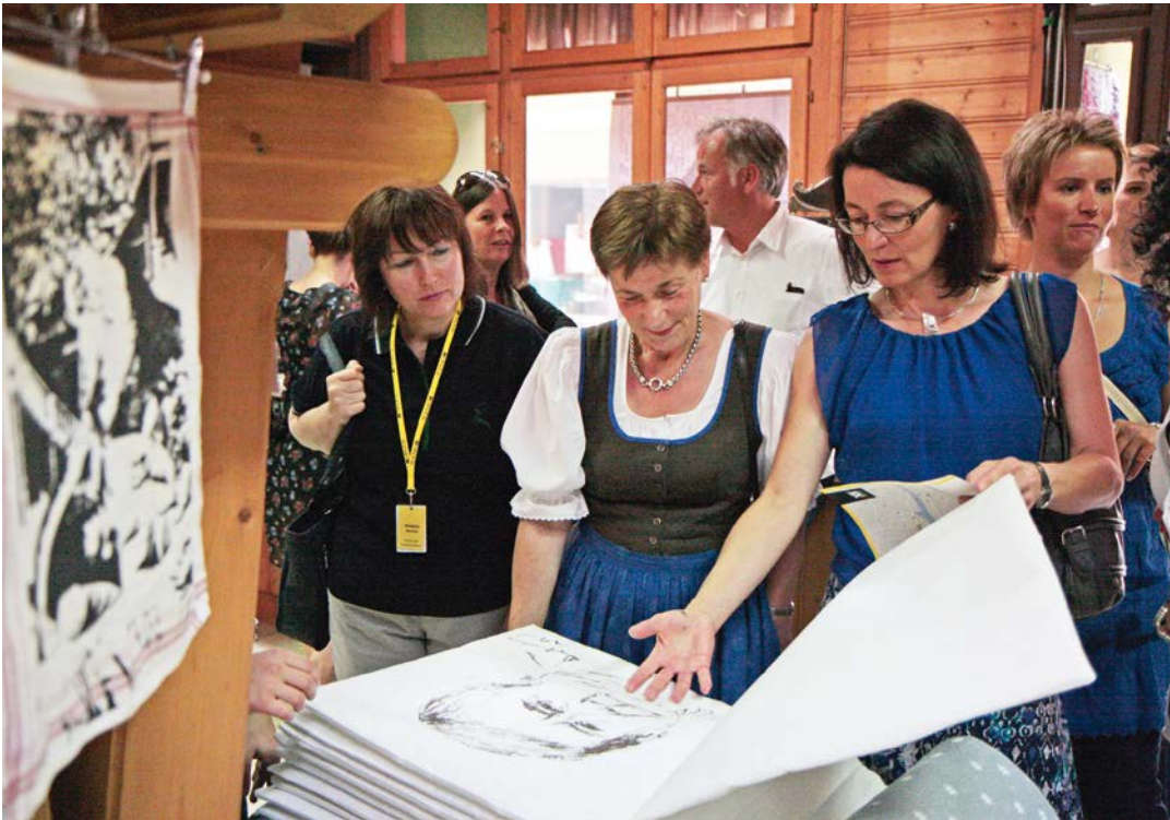
TEUFENBACH 1 Eröffnung des Shops in Murau Foto/Rappel