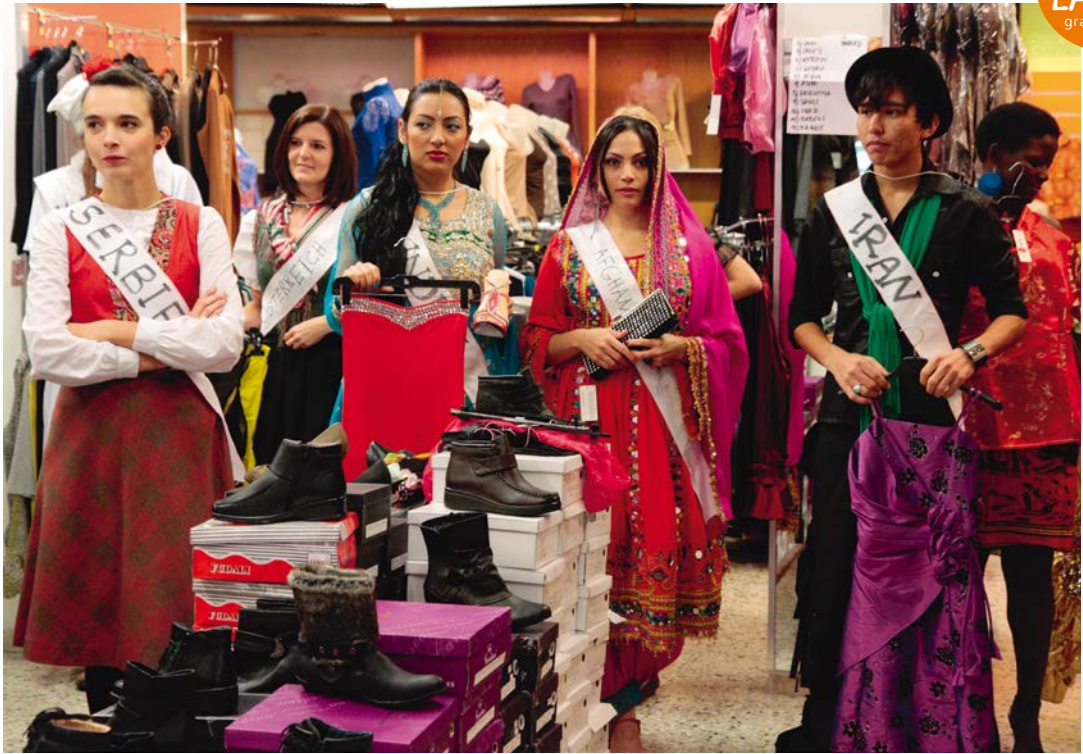
SHOPS OF STORIES ,Modenschau', Maryam Mohammadi/Jin Yan Foto/Rappel