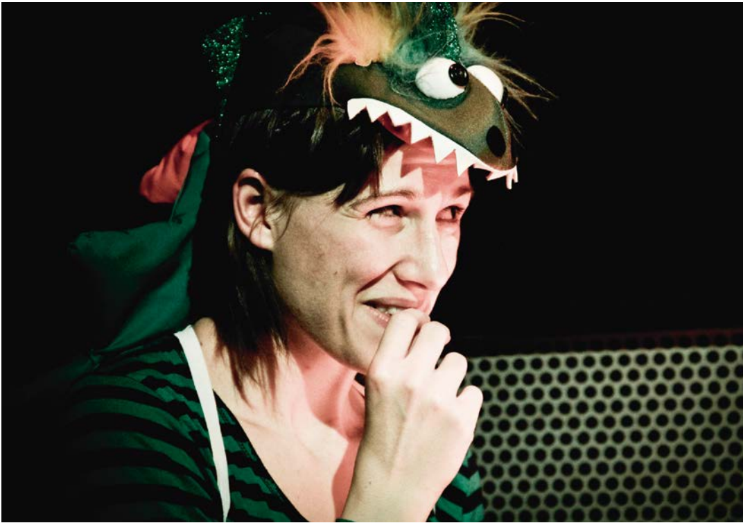
TARNEN UND TÄUSCHEN Studententheater, Regie: Astrid Ranner; Theater am Lend