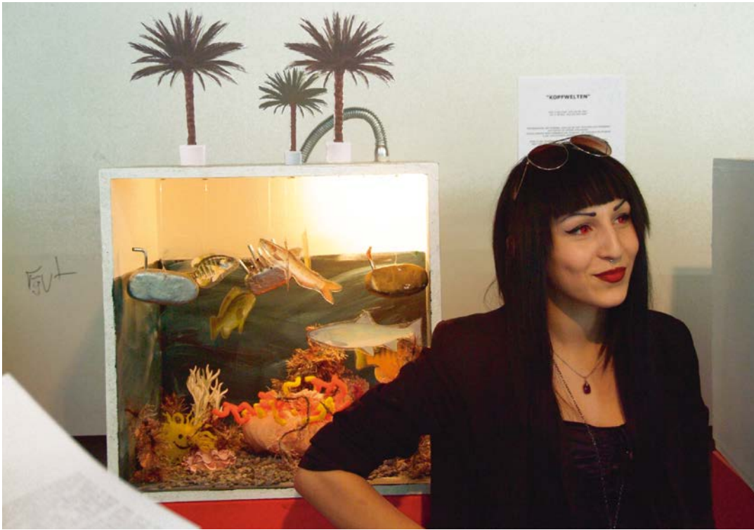
RAUS AUS DER BOX Präsentation ‚Kopfwelten‘