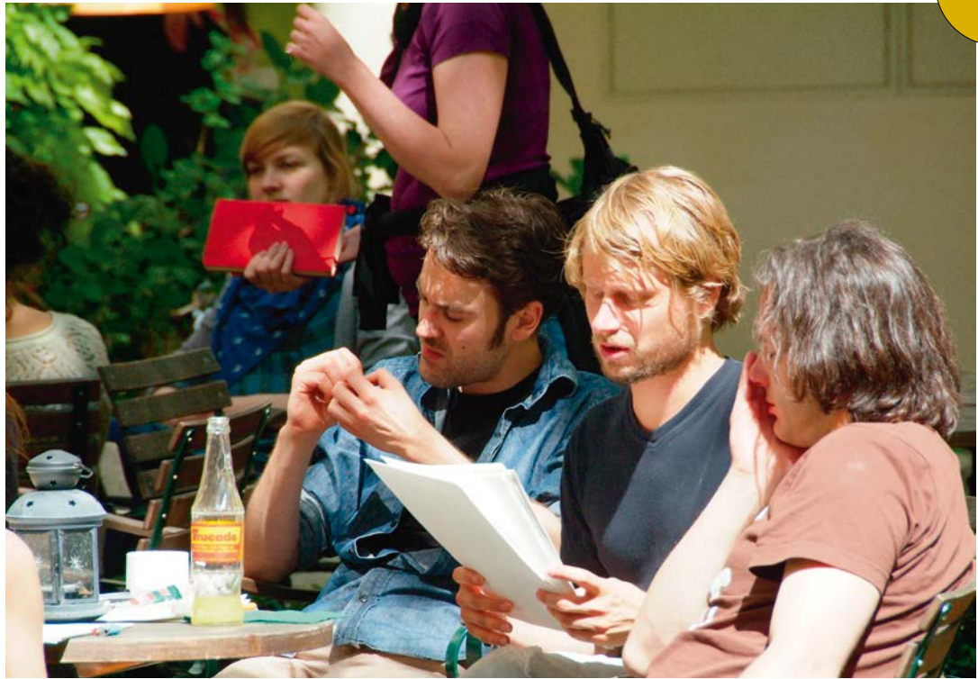
Interpretationssache 2012, Bildungshaus Schloss Retzhof