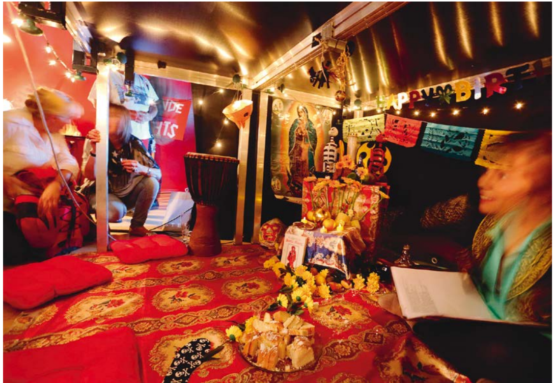
Pandemie Natascha Gangl, Theater am Lend