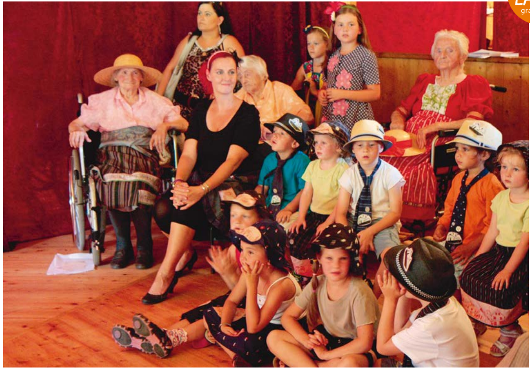
TEUFENBACH 1 Das Fest in Teufenbach