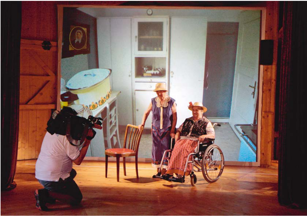
TEUFENBACH 1 Das Fest in Teufenbach / Tableau Vivant