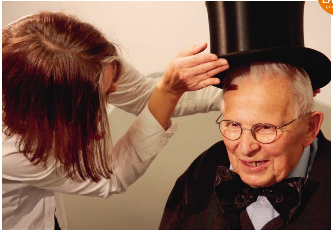
TEUFENBACH 1 Fotoshooting