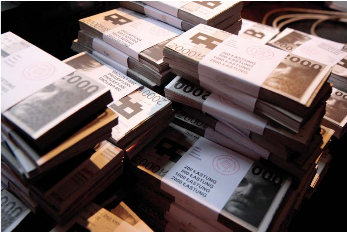
SHOPS OF STORIES ,Lastung', Mirko Maric