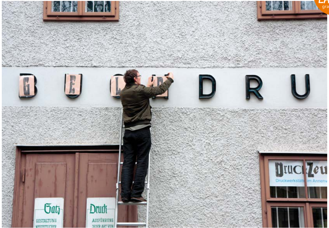
SHOPS OF STORIES ,Lastung', Mirko Maric