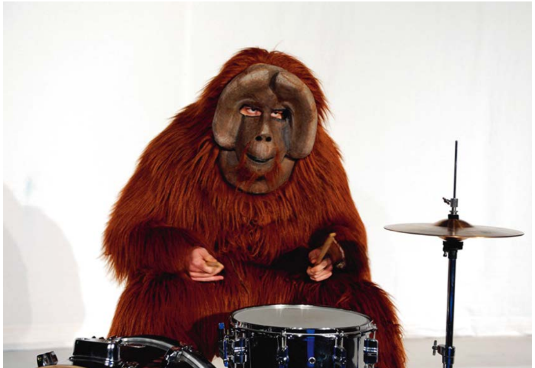
Die grosse zoologische Pandemie Natascha Gangl / Felix Meyer-Christan, Staatstheater Mainz