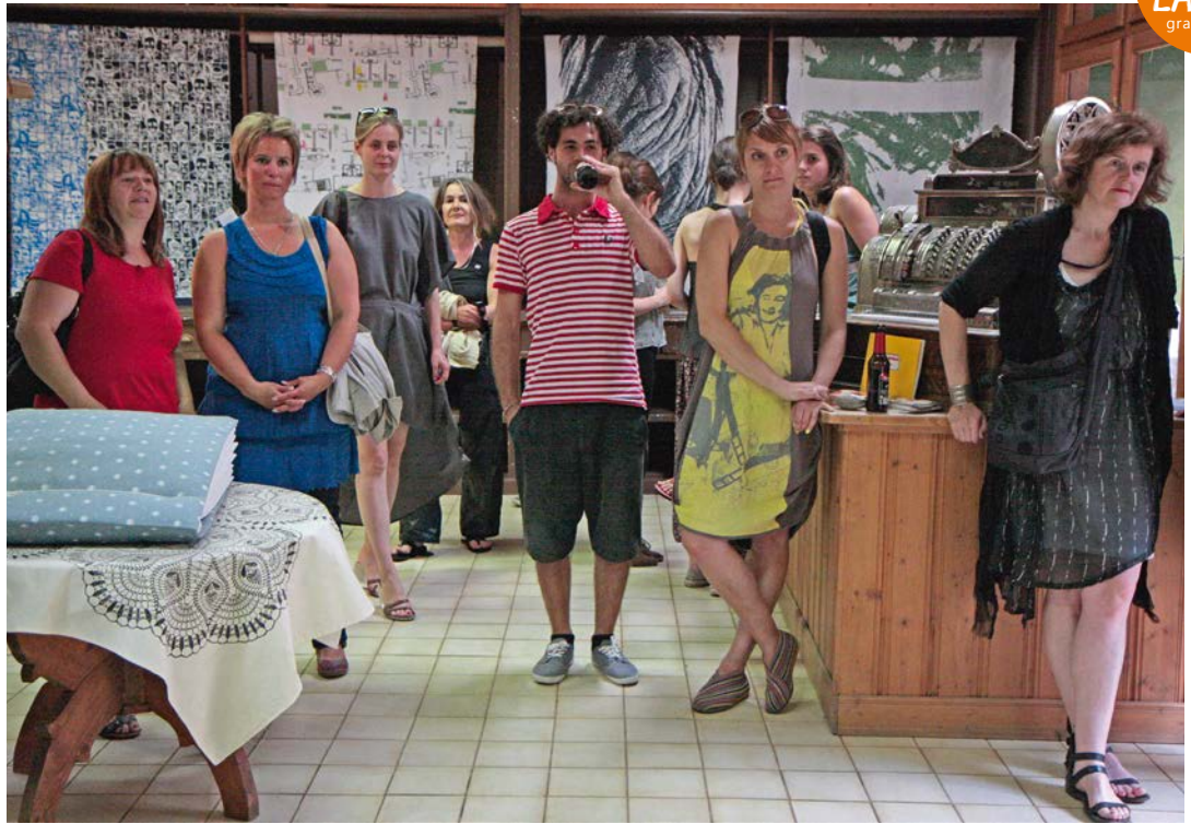
TEUFENBACH 1 Eröffnung des Shops in Murau