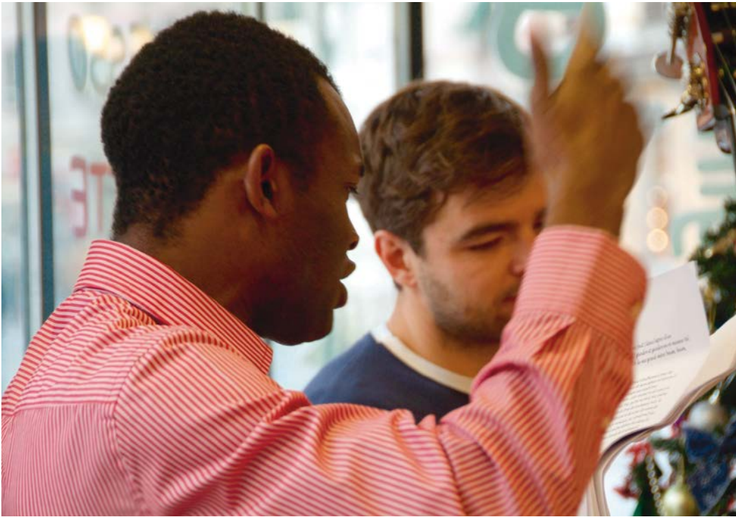
SHOPS OF STORIES Fiston Mwanza Foto/Rappel