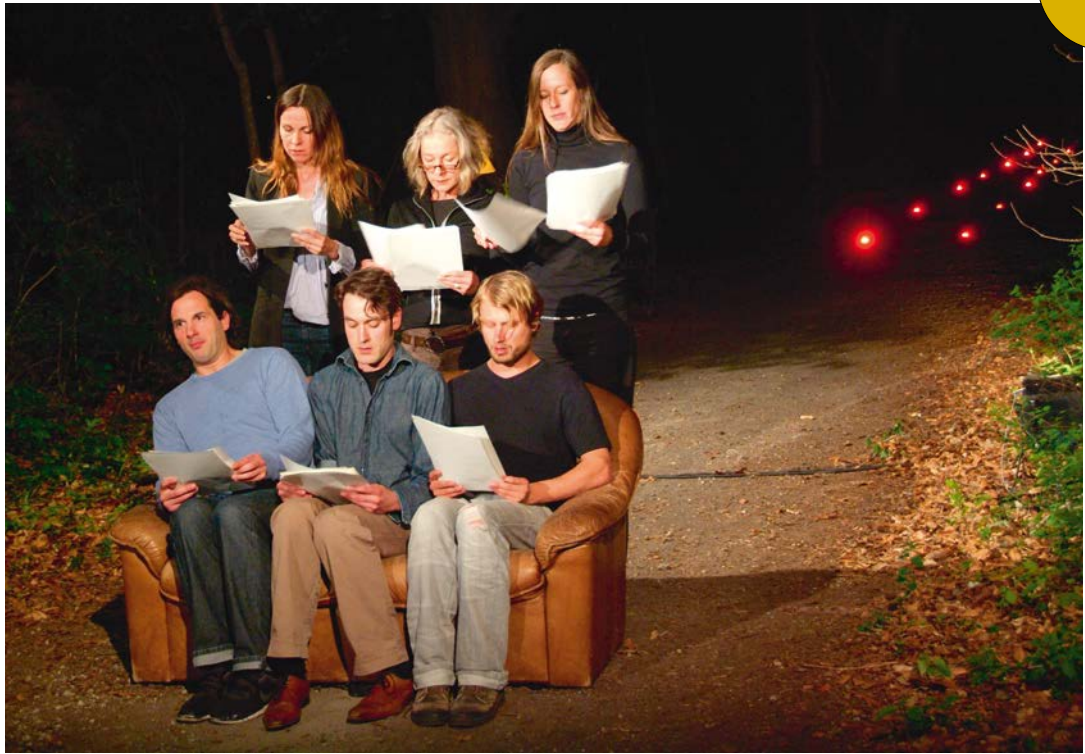
Interpretationssache 2012, Bildungshaus Schloss Retzhof