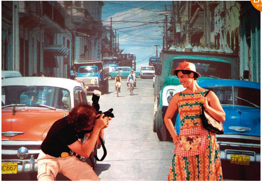
TEUFENBACH 1 Das Fest in Teufenbach / Tableau Vivant