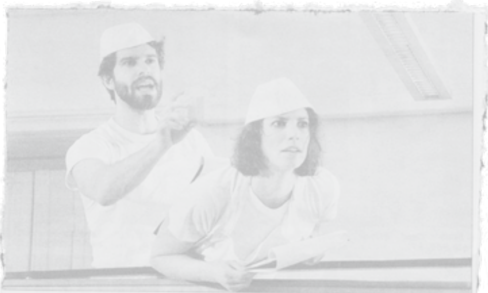
Adi und Karina entfliehen in Schmalz' Siegerstück „am beispiel der butter“ der eigenen Trägheit

Verleihung des Retzhofer Dramapreises 2013 in Leibnitz