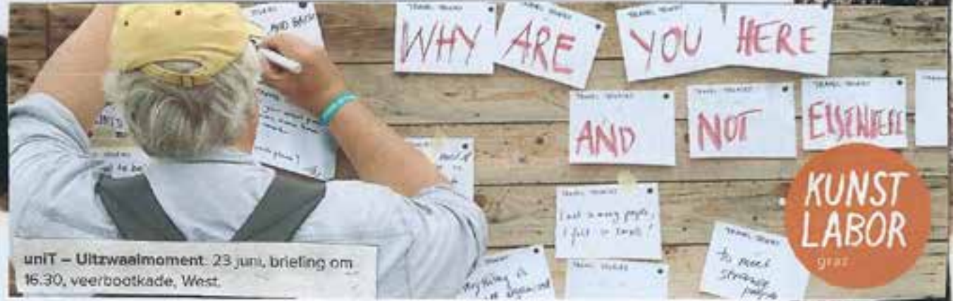
uniT – Uitzwaaimoment. 23 juni, briefing om 16.30, veerbootkade, West.